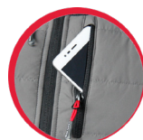
Ochrona przed promieniowaniem elektromagnetycznym

MATERIAŁ: Powłoka: 100% poliester typu pongee 80 g/m 2 oraz dzianina 80% poliester, 20% bawełna, 270 g/m 2 . Ocieplina: 180 g/m 2 . Podszewka: tafta 50 g/m 2 . Impregnowana tkanina pokryta AC zabezpieczająca przed wsiąkaniem wody. 4 kieszenie zamykane na suwak. Kieszeń na telefon komórkowy zabezpieczona tkaniną odbijającą promieniowanie elektromagnetyczne. Praktyczny kaptur z podszewką z jerseyu i regulacją za pomocą troczków. Zamek błyskawiczny. Osłona suwaka. Odblaskowe elementy. Dół kamizelki zakończony wygodnym i elastycznym ściągaczem. Ciepła, miękka i lekka zapewniająca komfort użytkowania. Modny i ciekawy design. NORMA: EN ISO 13688.